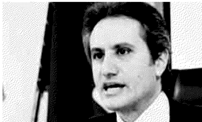
Governo Il presidente della Regione Stefano Caldoro; sotto, area industriale di Napoli